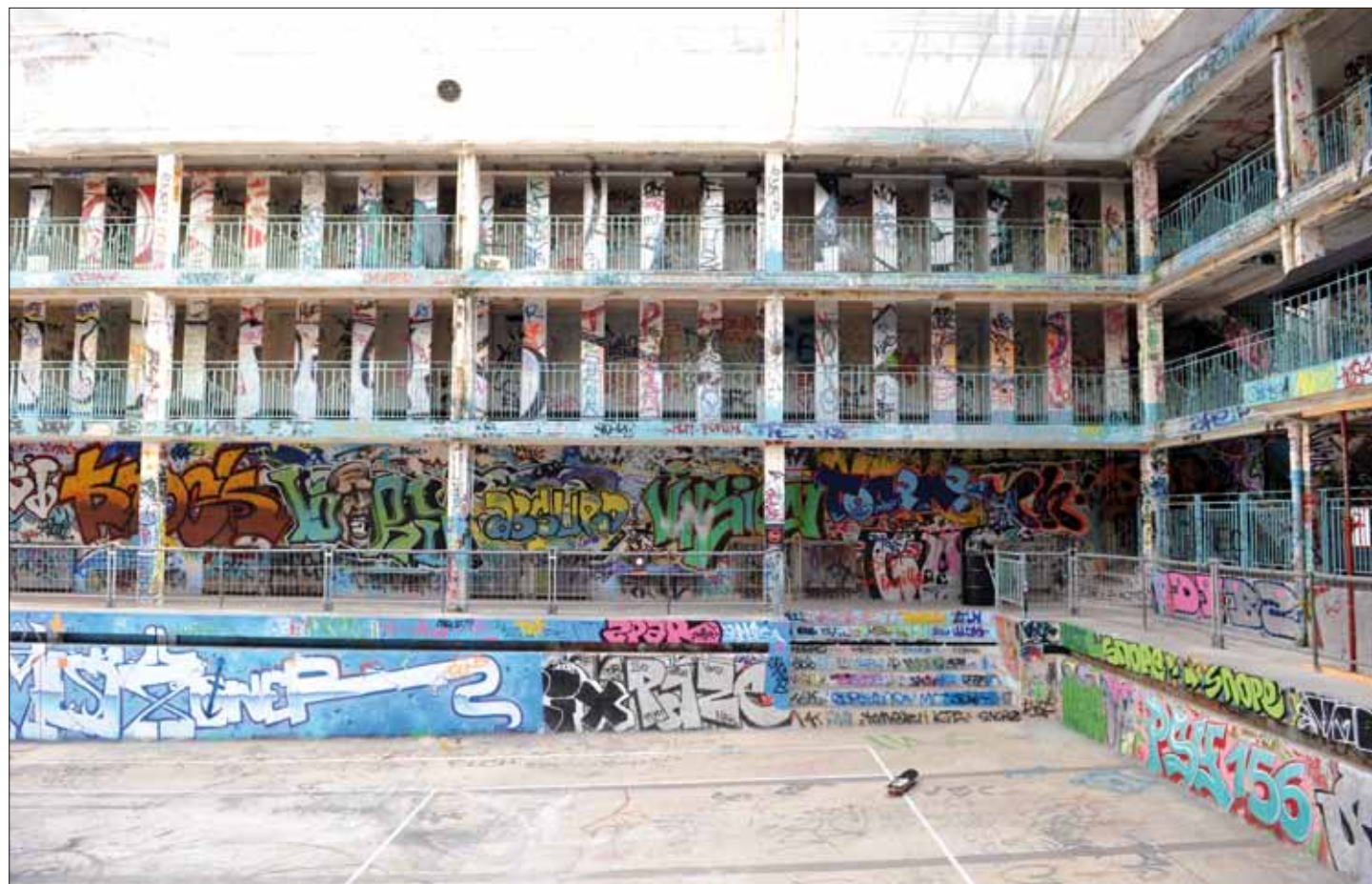
Sur cette page : La piscine Molitor à Paris. Villa à Sète.